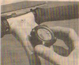
Esta es la llave del Segway.