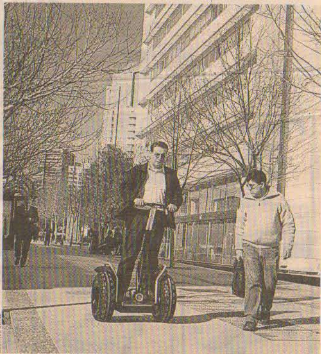
DIVERSIÓN.— Una vez aprendida la técnica, pura diversión.